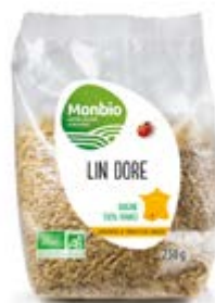
GRAINES DE LIN DORÉ