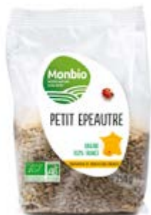
GRAINES DE PETIT ÉPEAUTRE