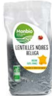
LENTILLES NOIRES BELUGA