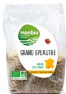
GRAINES DE GRAND ÉPEAUTRE