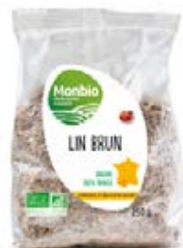
GRAINES DE LIN BRUN