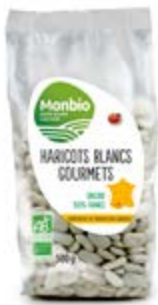
HARICOTS BLANCS « GOURMETS » — existe aussi en 250 g —