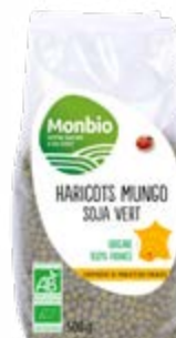
HARICOTS MUNGO MUNGO